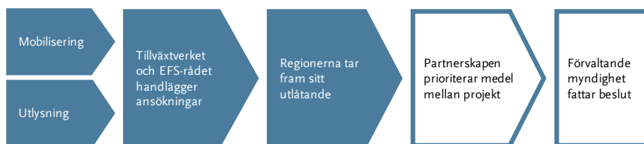
Figur 2 Steg i processen att bevilja EU-medel

I det här kapitlet beskriver och redovisar vi våra iakttagelser om hur Tillväxtverket, ESF-rådet, partnerskapen och regionerna i de olika partnerskapsområdena hanterar dessa inledande steg i processen: mobilisering, utlysning, myndigheternas handläggning och regionernas framtagande av sitt utlåtande.