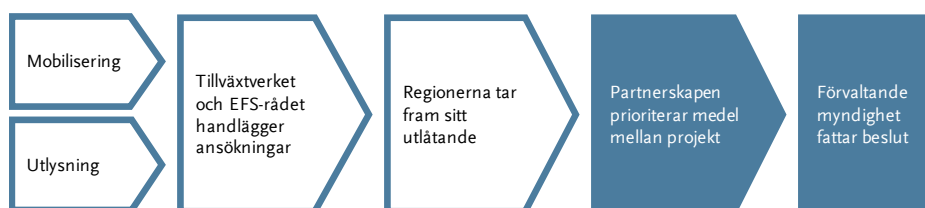
Figur 3 Steg i processen att bevilja EU-medel

I det här kapitlet beskriver vi och redovisar våra iakttagelser om hur partnerskapen bedriver arbetet med att prioritera medel mellan projekt, och hur det påverkar Tillväxtverkets och ESF-rådets beslut.