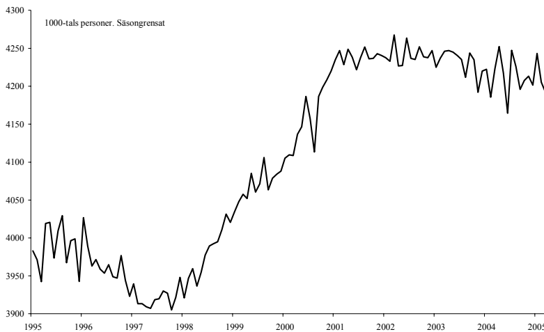
Diagram 1.1 Sysselsättning t.o.m. mars 2005

Den öppna arbetslösheten fortsatte att stiga under 2004 till en nivå på i genomsnitt 246 000 personer eller 5,5 % av arbetskraften. Den totala arbetslösheten, dvs. den öppna arbetslösheten plus antalet deltagare i olika arbetsmarknadspolitiska program, steg till i genomsnitt 7,9 %, från 7 % under 2003. Som framgår av diagram 1.2 har den öppna arbetslösheten säsongrensat varit något lägre under första kvartalet 2005 jämfört med första kvartalet 2004. Regeringen räknar också med att den öppna arbetslösheten fortsätter att sjunka under 2005 och 2006 i takt med att sysselsättningen stiger och antalet personer i arbetsmarknadspolitiska åtgärder ökar. I genomsnitt väntas en öppen arbetslöshet på 5 % respektive 4,4 % under 2005 och 2006. Den totala arbetslösheten, dvs. inklusive personer i arbetsmarknadspolitiska åtgärder, bedöms gå ned till 7,7 % under 2005 och 7,1 % under 2006.