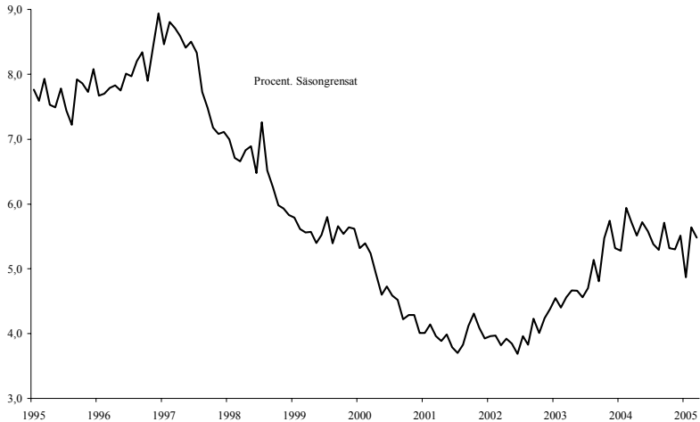
Diagram 1.2 Öppen arbetslöshet t.o.m. mars 2005

Som framgår av diagram 1.3 har sysselsättningsgraden i den svenska ekonomin minskat sedan början av 2001. Regeringens och riksdagens sysselsättningsmål är att antalet sysselsatta i åldern 20–64 år ska uppgå till 80 %. Under 2004 (som ursprungligen var det år sysselsättningsmålet skulle nås) sjönk sysselsättningsgraden med 0,6 procentenheter till 77 %.