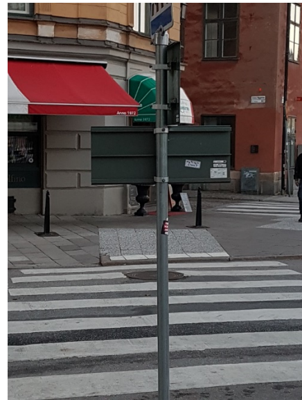
Bild 4 och 5. Här framgår den olämpliga utformningen mycket tydligt.

Trafikverket har en förordning som mycket tydligt reglerar både utformning och placering av vägs skyltar.