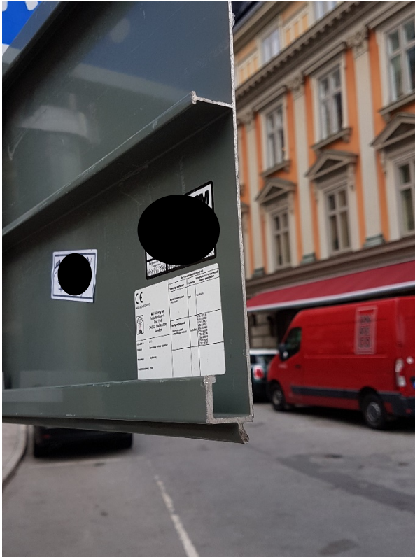
Bild 3. Baksidan av vägmärkets nedre vänstra hörn. Förstärkningsprofilerna på vägmärkets baksida är vassa och har skarpa hörn.