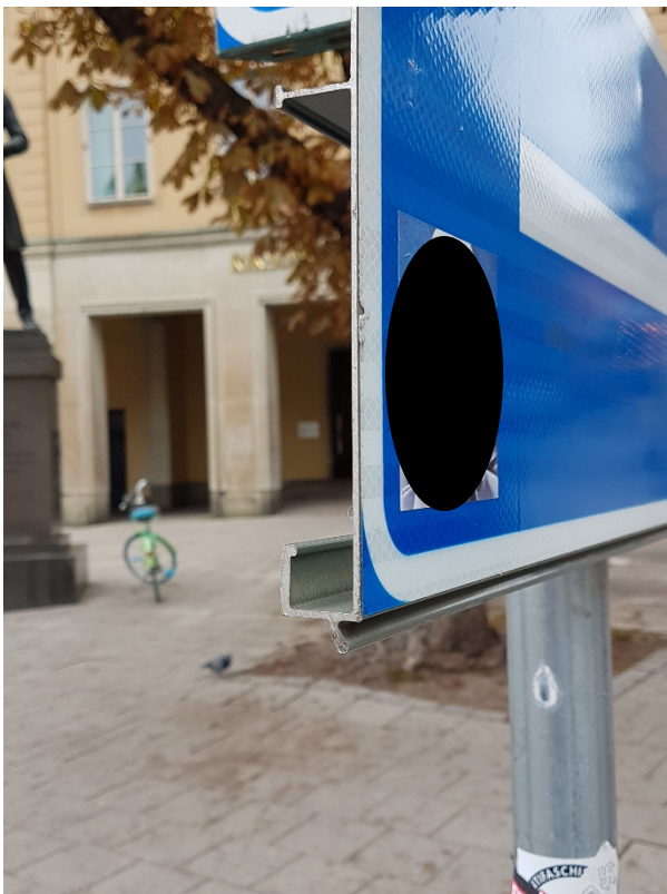
Bild 2. Vägmärkets nedre vänstra hörn. Vägmärket har en slät framsida, men baksidan har förstärkningsprofiler som är vassa och icke avfasade.