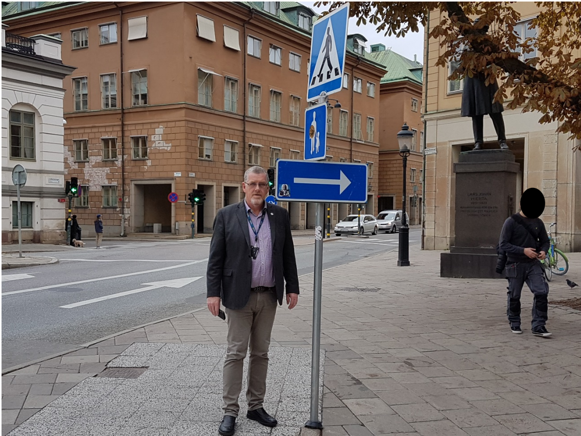
Bild 1. Fotot är taget i linje med övergångsstället. Figuranten har en längd på 1,89 meter. Vägmärket utgör en stor fara för fotgängare och kan orsaka svåra skador i ansikte eller i värsta fall skada synen. Bilderna är ett exempel för att illustrera en olycklig placering. Tyvärr finns det åtskilliga vägmärken runt om i landet där placeringen av vägmärket är sådan att de utgör en fara.