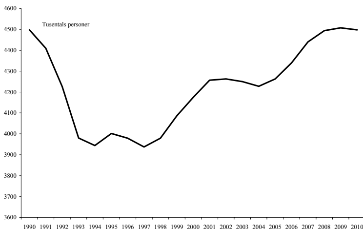
Diagram 1.1 Sysselsättningen 1990–2010

Anm. Streckad linje anger regeringens prognos 2007–2008 samt kalkyl 2009–2010.