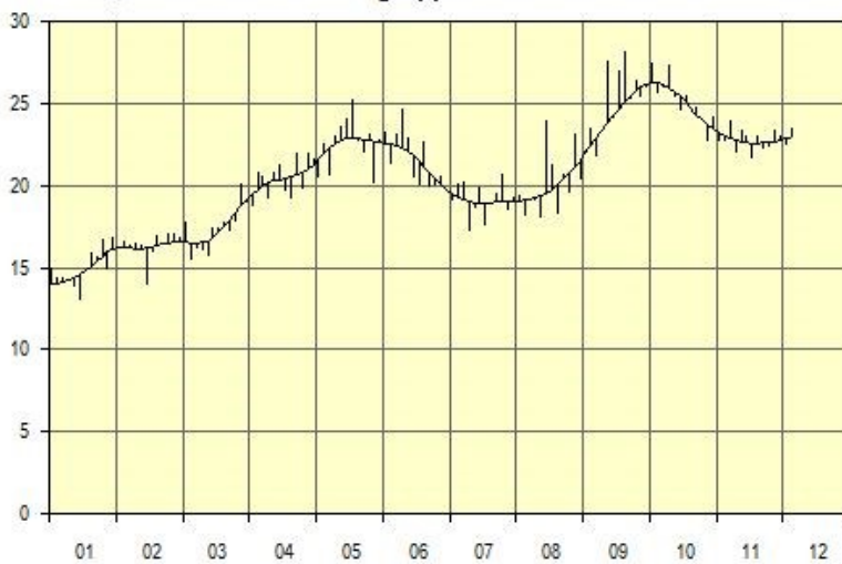
Arbetslösa, % av arbetskraften i gruppen 15-24 år 2001-2012

ökat kraftigt, främst på grund av arbetslöshet och svag utbildning 3 . Samtidigt som sysselsättningen väntas minska framöver råder det brist på kvalificerad arbetskraft, och stora pensionsavgångar väntar. Enligt Arbetsförmedlingens prognos väntas brist på kvalificerad arbetskraft, särskilt inom byggbranschen, hälso- och sjukvårdssektorn samt vissa läraryrken 4 .