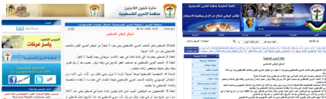
PLO – Refugee Department and PLO Executive Committee – The National Office for Defence of the Land and for Resistance to the Settlements.

När Osloavtalet slöts i september 1993 mellan PLO och Israel ställdes krav på att PLO ändrade de artiklar i den palestinska nationella stadgan som förnekade Israels rätt att existera. 1998 togs till exempel artikel 9, som handlar om att väpnad kamp är det enda sättet att befria Palestina på, och artikel 15, som handlar om att befrielsen av Palestina är en arabisk plikt och kräver att sionismen tillintetgörs, bort från 1968 års palestinska nationella stadga. Trots detta ligger samma nationella stadga kvar på en rad olika officiella myndighetssidor och Facebooksidor för den palestinska myndigheten.