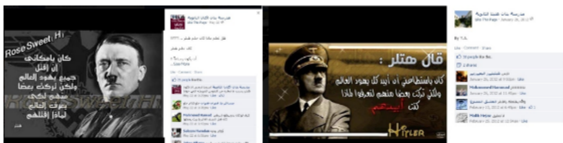
Facebooksida för Iktabaskolan för flickor i Tulkarm (22 maj 2012) och Facebooksidan för flickskolan Anabtās i Tulkarm (26 januari 2012).

Det PLO-sponsrade barnmagasinet Zayzafuna, som grundades av den palestinska myndigheten, framställer Hitler som en förebild. I februari 2011 publicerades en uppsats av en flicka som beskriver en dröm, i vilken hon möter prominenta personer som beskrivs som förebilder. Bland annat möter hon matematikern Al-Khwarizmi, den egyptiske författaren Naguib Mahfouz, erövraren Saladin och Hitler. Hon skriver om hur hon står framför fyra dörrar. Bakom en av dem finns Adolf Hitler. Hon ställer en fråga till honom. ”Är du den som dödade judarna?”. Han svarar: ”Ja, jag dödade dem så ni alla skall förstå att de är en nation som sprider förstörelse över hela världen. Och vad jag ber dig om är att vara uthållig och tålmodig gällande lidandet som Palestina upplever från deras sida”. Flickan svarar: ”Tack för rådet”.