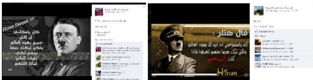
Facebooksida för Iktabaskolan för flickor i Tulkarm (22 maj 2012) och Facebooksidan för flickskolan Anabtas i Tulkarm (26 januari 2012).

Det PLO-sponsrade barnmagasinet Zayzafuna, som grundades av den palestinska myndigheten, framställer Hitler som en förebild. I februari 2011 publicerades en uppsats av en flicka som beskriver en dröm, i vilken hon möter prominenta personer som beskrivs som förebilder. Bland annat möter hon matematikern Al-Khwarizmi, den egyptiske författaren Naguib Mahfouz, erövraren Saladin och Hitler. Hon skriver om hur hon står framför fyra dörrar. Bakom en av dem finns Adolf Hitler. Hon ställer en fråga till honom. ”Är du den som dödade judarna?” Han svarar: ”Ja, jag dödade dem så ni alla skall förstå att de är en nation som sprider förstörelse över hela världen. Och vad jag ber dig om är att vara uthållig och tålmodig gällande lidandet som Palestina upplever från deras sida.” Flickan svarar: ”Tack för rådet.”