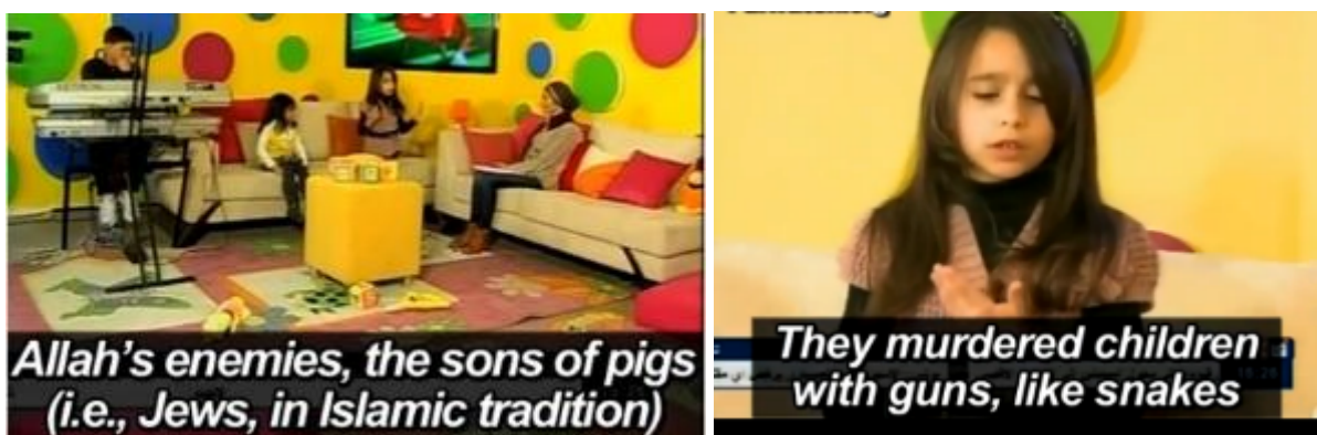
Palestinsk barn-tv framställer judarna som grisars avkommor. (PA TV – 22 mars 2013)

I palestinsk barn-tv från den 22 mars 2013 framställer man judarna som grisars avkommor och att de mördar barn med gevär och skär av armar och ben med sten och knivar samt våldtar kvinnor i kvartershörnen. Man ställer frågan var Jihadkrigarna befinner sig och var rädslan för Allah finns i Jerusalem som är befläckt av sionisterna.