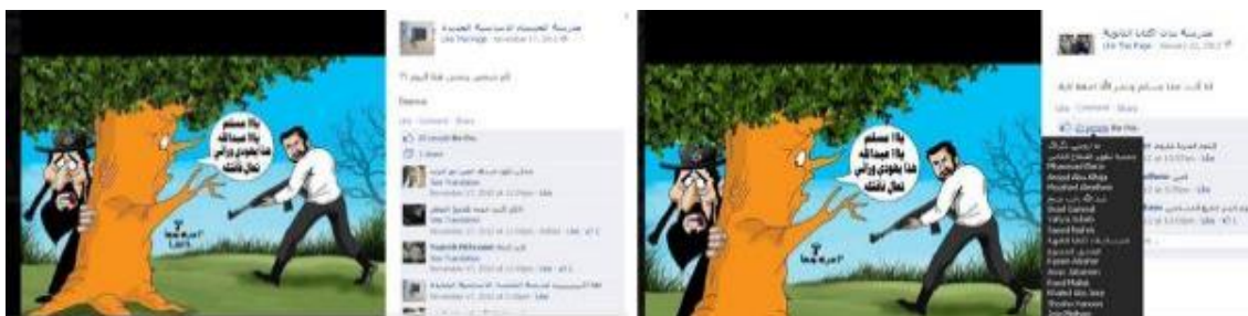
Vänster – Facebooksida från 'Al-Khansa' new elementary school for girls in Jenin (17 november 2012). Höger – Facebooksida från 'Iktaba' girls high school in Tulkarm, 22 januari 2012).

I palestinsk barn-tv från den 22 mars 2013 framställer man judarna som grisars avkommor och att de mördar barn med gevär och skär av armar och ben med sten och knivar samt våldtar kvinnor i kvartershörnen. Man ställer frågan var Jihadkrigarna befinner sig och var rädslan för Allah finns i Jerusalem som är befläckt av sionisterna.