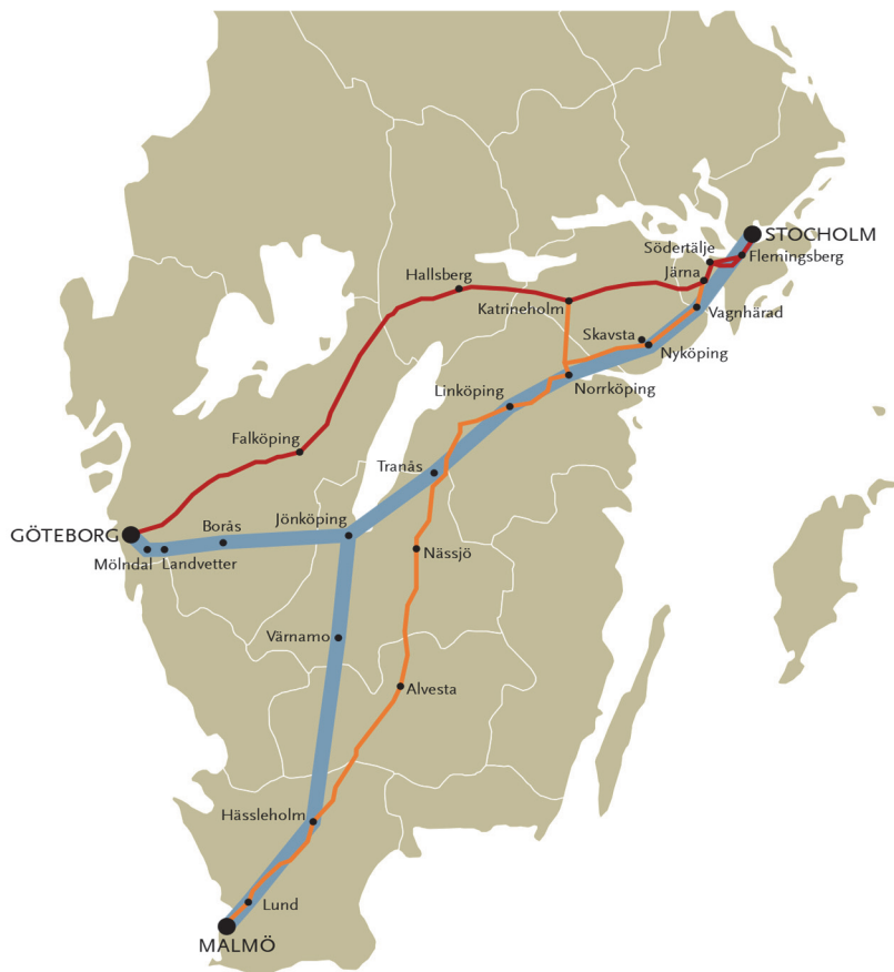
Figur 1 Karta över tänkt höghastighetsjärnväg (blå sträckning). Röd sträckning är den nuvarande västra stambanan, och orange sträckning är den nuvarande södra stambanan.