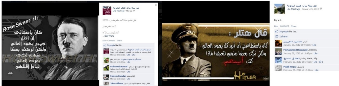
Facebooksida för Iktabaskolan för flickor i Tulkarm (22 maj 2012) och Facebooksidan för flickskolan Anabtas i Tulkarm (26 januari 2012).

Det PLO-sponsrade barnmagasinet Zayzafuna, som grundades av den palestinska myndigheten, framställer Hitler som en förebild. I februari 2011 publicerades en uppsats av en flicka som beskriver en dröm, i vilken hon möter prominenta personer som beskrivs som förebilder. Bland annat möter hon matematikern al-Khwarizmi, den egyptiske författaren Naguib Mahfouz, erövraren Saladin och Hitler. Hon skriver om hur hon står framför fyra dörrar. Bakom en av dem finns Adolf Hitler. Hon ställer en fråga till honom. ”Är du den som dödade judarna?”. Han svarar: ”Ja, jag dödade dem så ni alla skall förstå att de är en nation som sprider förstörelse över hela världen. Och vad jag ber dig om är att vara uthållig och tålmodig gällande lidandet som Palestina upplever från deras sida.” Flickan svarar: ”Tack för rådet.”