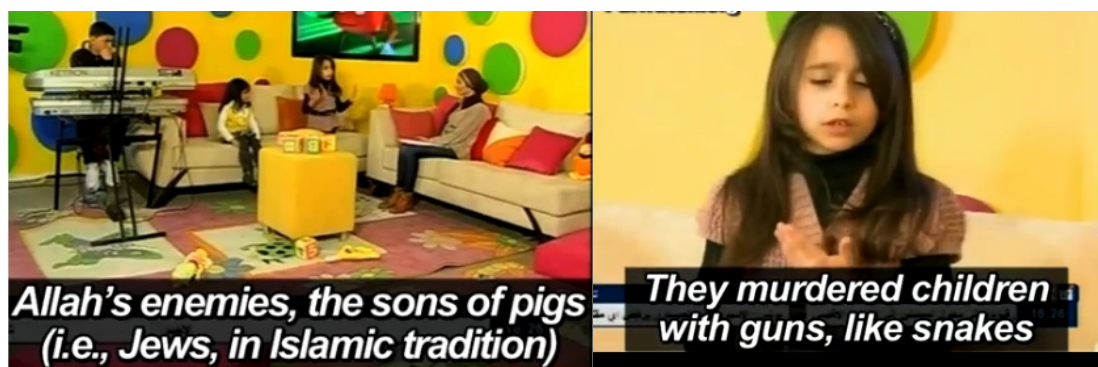
Palestinsk barn-tv framställer judarna som grisars avkommor (PA TV – 22 mars 2013).

I palestinsk barn-tv från den 22 mars 2013 framställer man judarna som grisars avkommor och att de mördar barn med gevär och skär av armar och ben med sten och knivar samt våldtar kvinnor i kvartershörnen. Man ställer frågan var Jihadkrigarna befinner sig och var rädslan för Allah finns i Jerusalem som är befläckt av sionisterna.