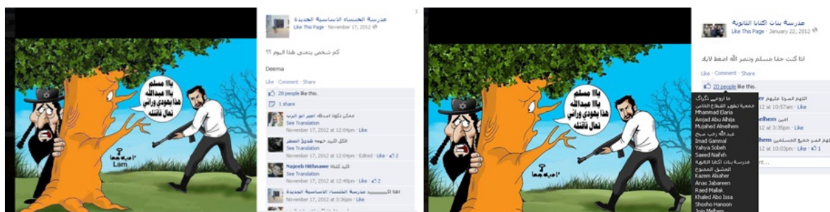
Vänster – Facebooksida från ”al-Khansa” new elementary school for girls in Jenin (17 november 2012). Höger – Facebooksida från ”Iktaba” girls high school in Tulkarm, 22 januari 2012).

ett träd och där trädet säger: ”O muslim, o Guds dyrkare, det finns en jude bakom mig, kom och döda honom.”