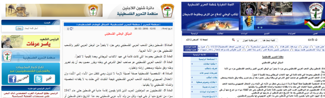
PLO – Refugee Department and PLO Executive Committee – The National Office for Defence of the Land and for Resistance to the Settlements.

När Osloavtalet slöts i september 1993 mellan PLO och Israel ställdes krav på att PLO ändrade de artiklar i den palestinska nationella stadgan som förnekade Israels rätt att existera. 1998 togs till exempel artikel 9, som handlar om att väpnad kamp är det enda sättet att befria Palestina på, och artikel 15, som handlar om att befrielsen av Palestina är en arabisk plikt och kräver att sionismen tillintetgörs, bort från 1968 års palestinska nationella stadga. Trots detta ligger samma nationella stadga kvar på en rad olika officiella myndighetssidor och Facebooksidor för den palestinska myndigheten.