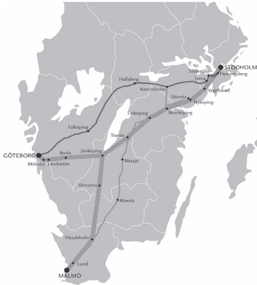
Figur 1 Karta över tänkt höghastighetsjärnväg (blå sträckning). Röd sträckning är den nuvarande västra stambanan, och orange sträckning är den nuvarande södra stambanan.