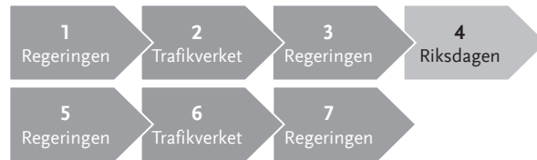
Figur 2 Den övergripande nationella infrastrukturplaneringens fyraårscykel

Varje revidering av planen inleds normalt med att regeringen ger Trafikverket i uppdrag att ta fram ett inriktningsunderlag för transportinfrastrukturplanering inför nästa period (se Figur 2). Det senaste inriktningsunderlaget redovisades i november 2015 och togs fram inför den nuvarande planeringsperioden 2018–2029.