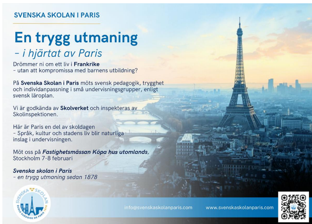
Figur 3 Exempel på marknadsföring av en svensk utlandsskola

Skolorna marknadsför sig ofta med att de får tillsyn av Skolinspektionen och är godkända av Skolverket. Figur 3 visar ett exempel på sådan marknadsföring.