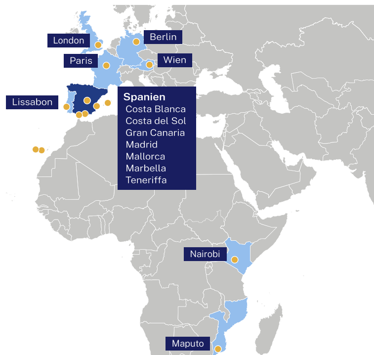
Figur 2 Lokalisering av svenska utlandsskolor läsåret 2025/26