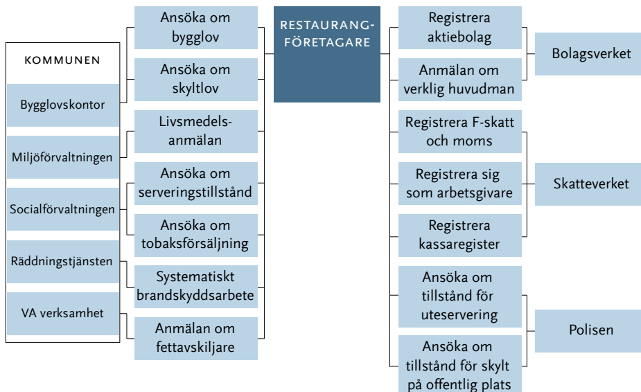
Figur 1 Exempel på en restaurangföretagares myndighetskontakter för att starta företag