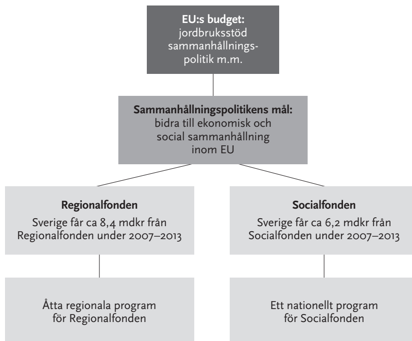
Figur 2.1. Strukturfonderna från EU:s budget till svenskt genomförande

Den europeiska sammanhållningspolitiken syftar till att minska de ekonomiska och sociala skillnaderna inom EU och öka sammanhållningen mellan länderna i unionen. De fonder som ingår i sammanhållningspolitiken är de två strukturfonderna Socialfonden och Regionalfonden, samt Sammanhållningsfonden. Sverige får medel från de två förstnämnda fonderna.