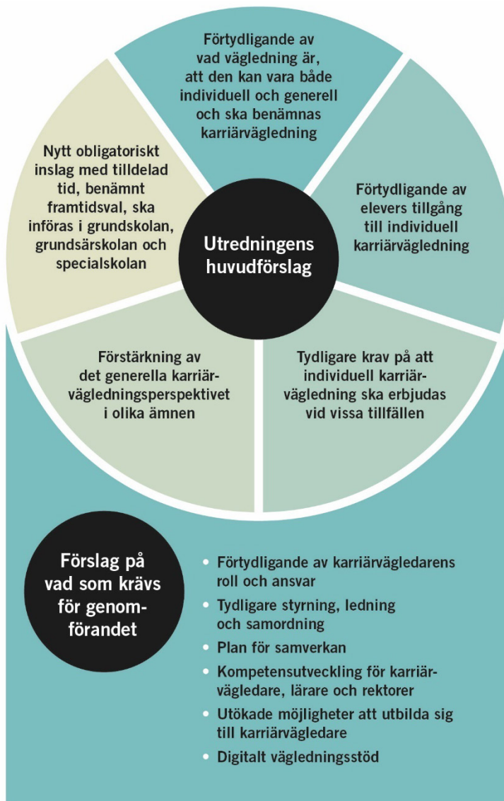
Figur 10.1 Utredningens huvudförslag och förslag på vad som krävs för genomförandet