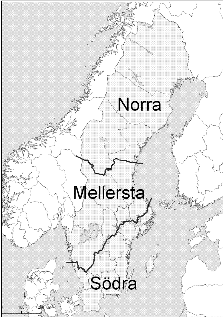
Karta över de tre rovdjursförvaltningsområdena

Med tre förvaltningsområden underlättas länsstyrelsernas inbördes samverkan och samverkan med Sametinget. Rovdjursförvaltningsområdena